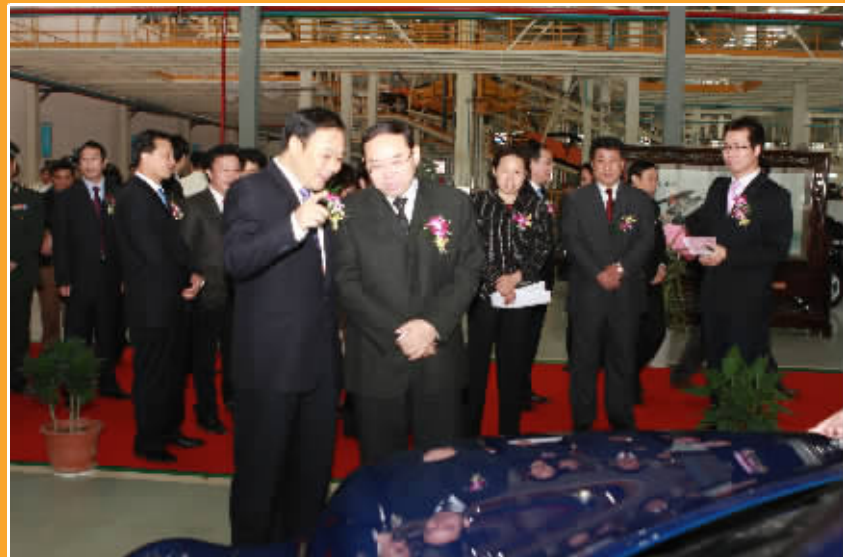
李书福董事长为前来出席庆典的湖南省委副书记梅克保介绍吉利汽车。