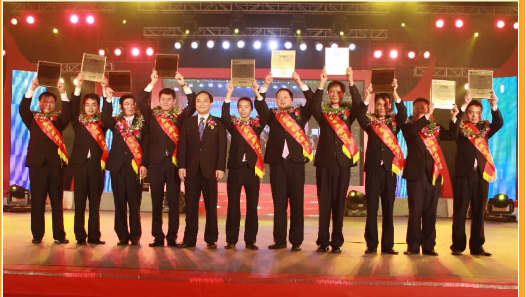
李书福董事长为第七届“书福奖”获得者颁奖。