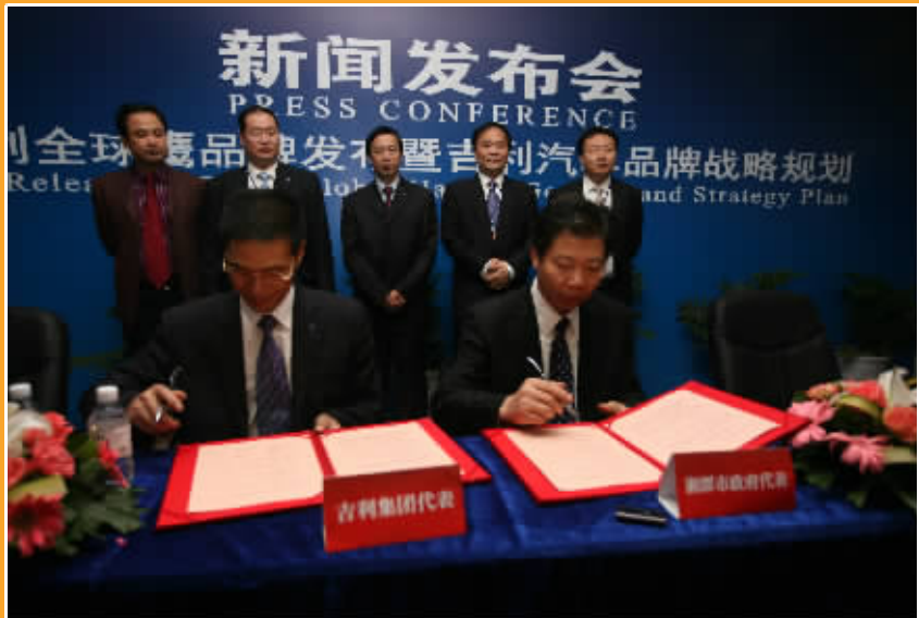
新闻发布会上,吉利与湘潭市签署政府采购协议。