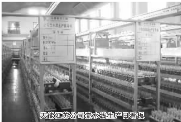
天能江苏公司流水线生产日看板