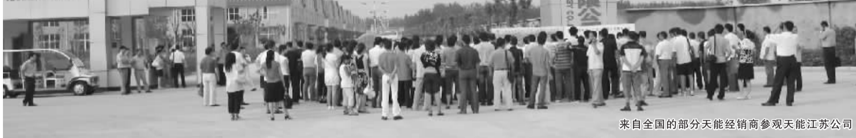
来自全国的部分天能经销商参观天能江苏公司

“在全球经济危机的大背景下，天能电池今年上半年的市场份额不降反升，其秘诀是产品的技术领先，依靠技术创新不断扩大了市场份额。”近日，在接受记者关于天能上半年营销情况的采访时，天能集团有关负责人如是说。