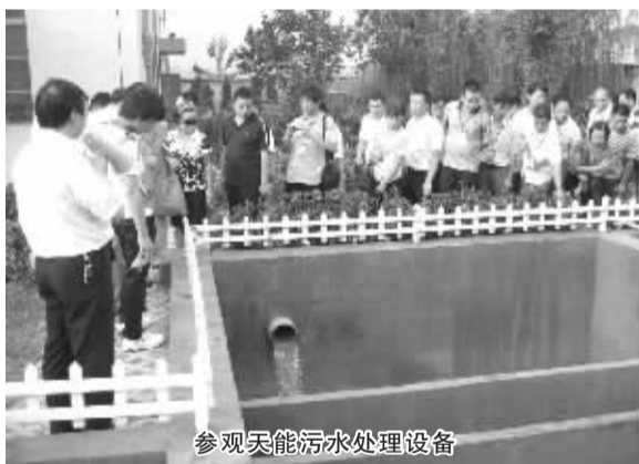
参观天能污水处理设备